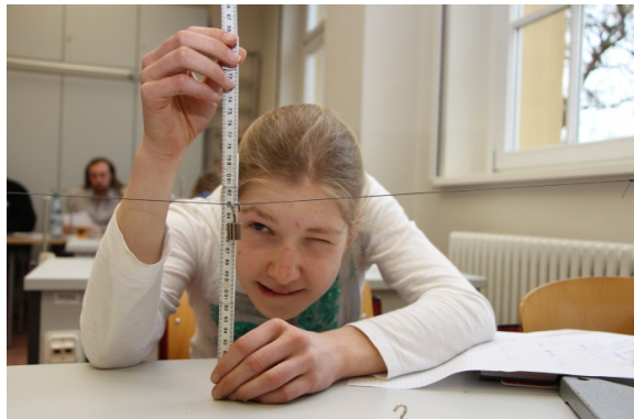
Experimentelle Aufgabe, Klasse 7