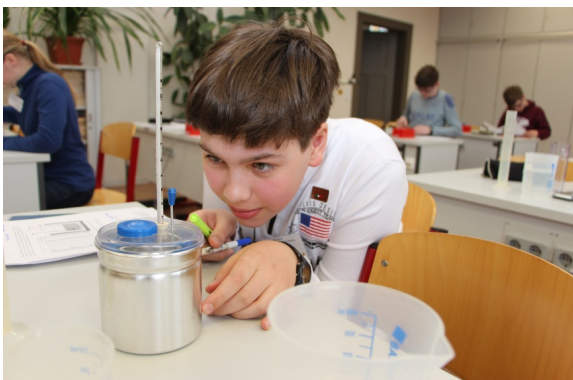
Experimentelle Aufgabe, Klasse 8