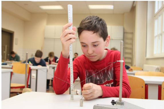
Experimentelle Aufgabe, Klasse 7