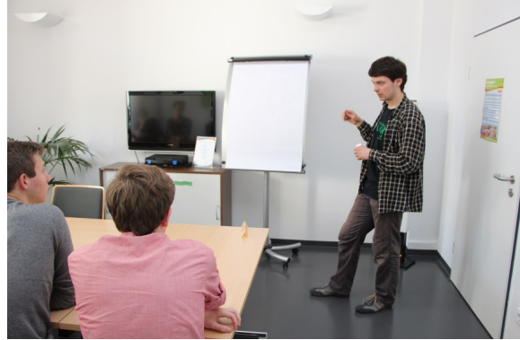
Vortrag „Thermische Energie“